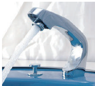
V-88 泡沫吐水 毎分約 3.5 l ※水压環境による