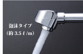
泡沫タイプ （約 3.5 l/m）