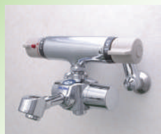
MX-HS サーモスタット混合栓