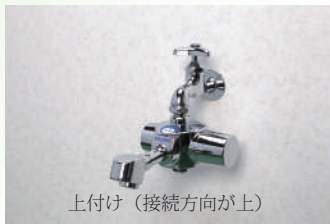
上付け（接続方向が上）