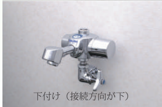
下付け（接続方向が下）