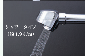
シャワータイプ （約 1.9 l/m）