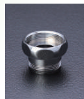
19 mm用 アダプタ